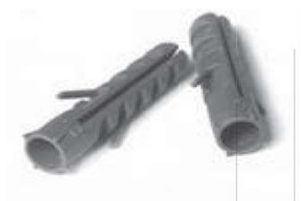
Рисунок 2 – Внешний вид пластикового дюбеля

- с помощью пластиковых дюбелей (тип и размеры указываются в проекте на монтаж системы диспетчерского контроля), устанавливаемых в просверленные (пробитые) гнезда (пример пластикового дюбеля представлен на рисунке 2);